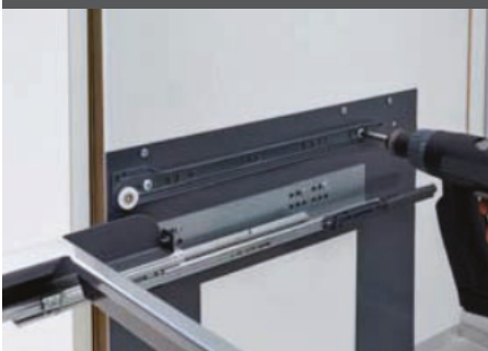
1) Korpussschienen montieren