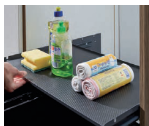
Pullboy Soft Comfort 2