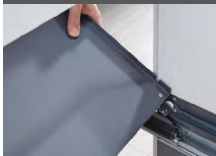
2) Deckel einhängen