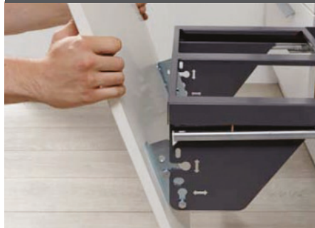
5) Tür einhängen