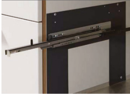
2) Führungen befestigen