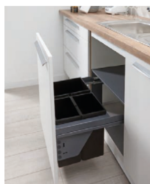
Pullboy Soft Comfort 1