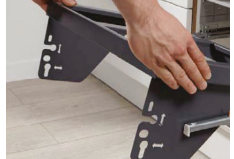
3) Rahmen einhängen