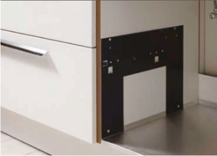
1) Schablonen anschrauben