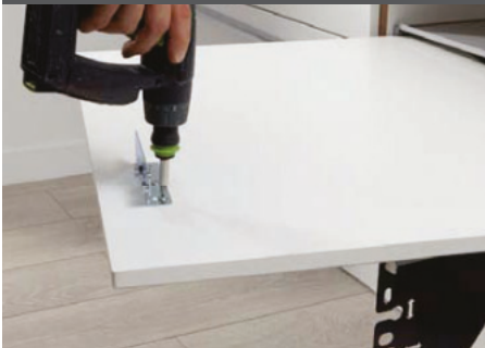
4) Frontwinkel befestigen