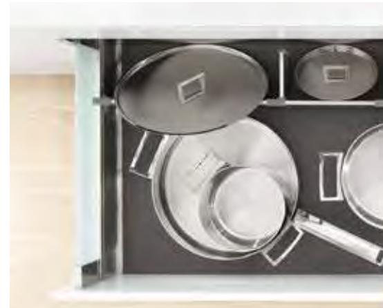
ORGA-LINE für Töpfe und Deckel