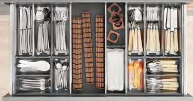
ORGA-LINE für Essbesteck

Weitere Infos unter: http://www.lignoshop.de