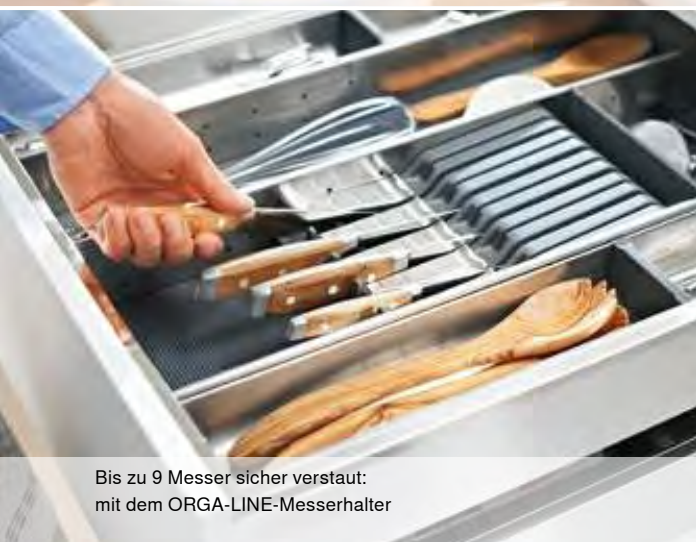
Bis zu 9 Messer sicher verstaut: mit dem ORGA-LINE-Messerhalter