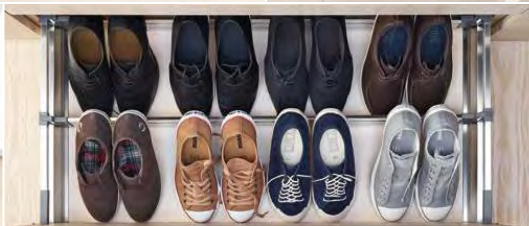
ORGA-LINE für die Garderobe