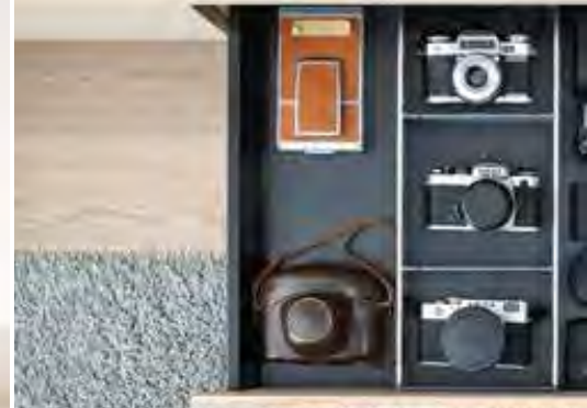
ORGA-LINE für den Wohnbereich

Weitere Infos unter: http://www.lignoshop.de