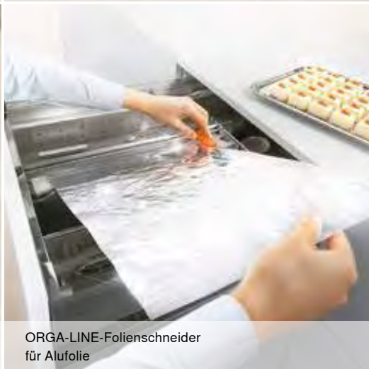
ORGA-LINE-Folienstecher für Alufolie