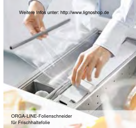
ORGA-LINE-Folienschneider für Frischhaltefolie

Erfahren Sie mehr unter: www.blum.com/ideas