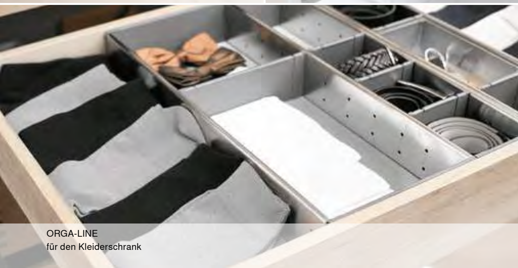
ORGA-LINE für den Kleiderschrank