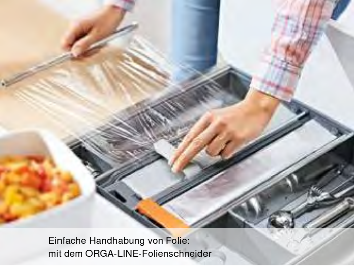
Einfache Handhabung von Folie: mit dem ORGA-LINE-Folienschneider