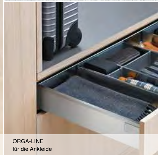
ORGA-LINE für die Ankleide