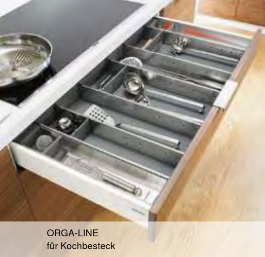
ORGA-LINE für Kochbesteck