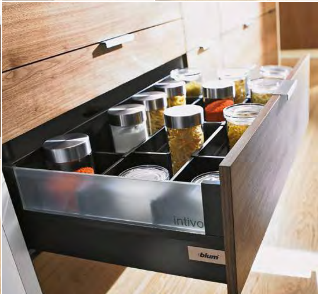
ORGA-LINE für Vorräte