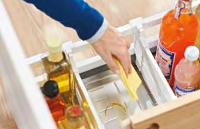
Schnell zu reinigen: die hochwertige ORGA-LINE-Flaschenwanne