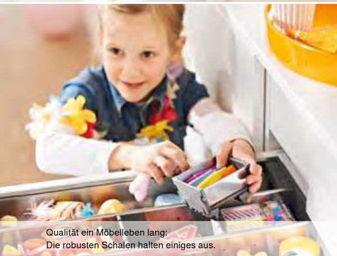
Qualität ein Möbelleben lang: Die robusten Schalen halten einiges aus.