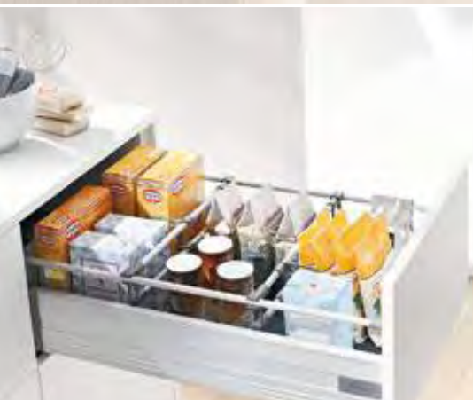
ORGA-LINE für Backzutaten