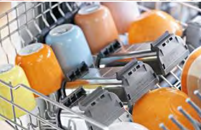
Spülmaschinenfest: die Edelstahl-Schalen von ORGA-LINE