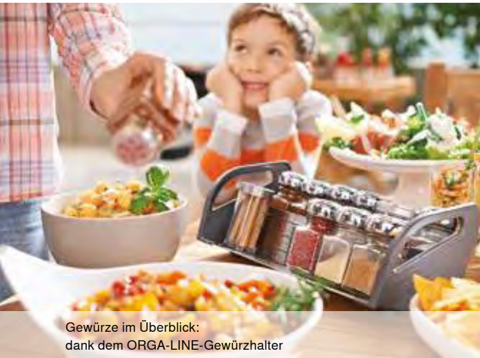
Gewürze im Überblick: dank dem ORGA-LINE-Gewürzhalter