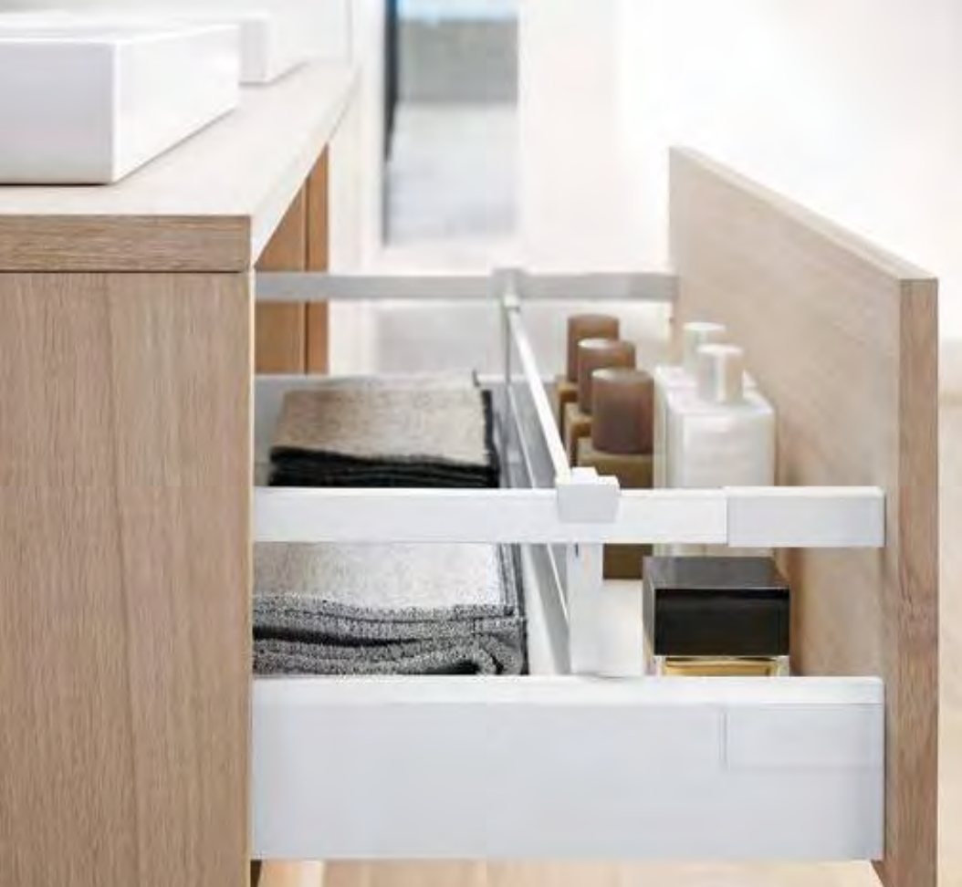
ORGA-LINE für Badutensilien