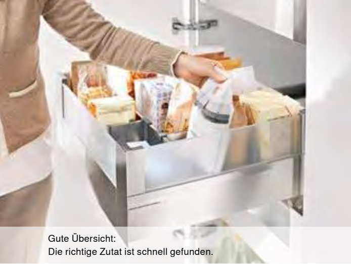
Gute Übersicht: Die richtige Zutat ist schnell gefunden.