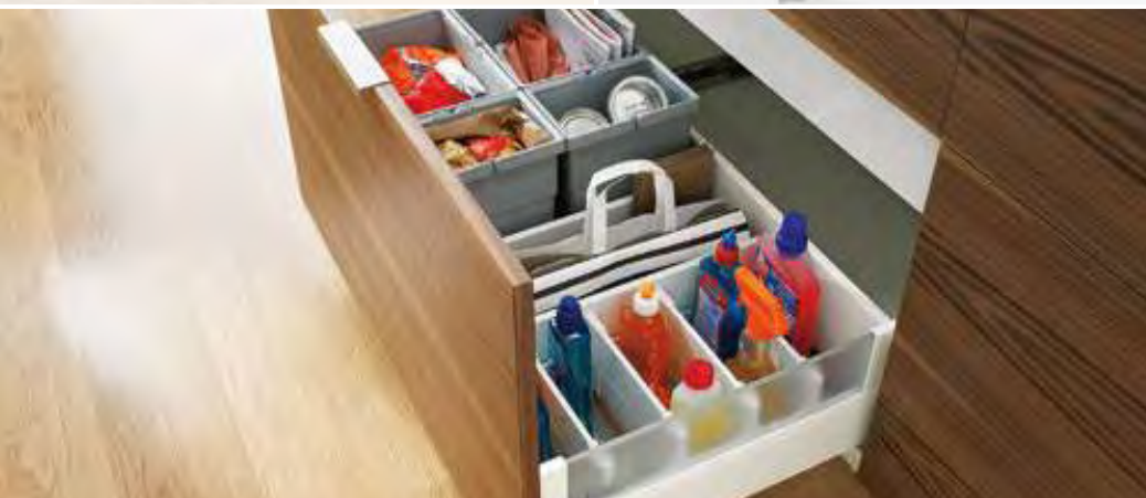
ORGA-LINE für Wertstofftrennung und Reinigungsmittel