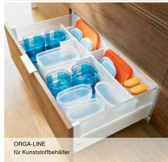
ORGA-LINE für Kunststoffbehälter