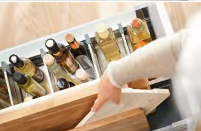
Sicherer Stand: für Schneidbretter und Flaschen jeder Größe