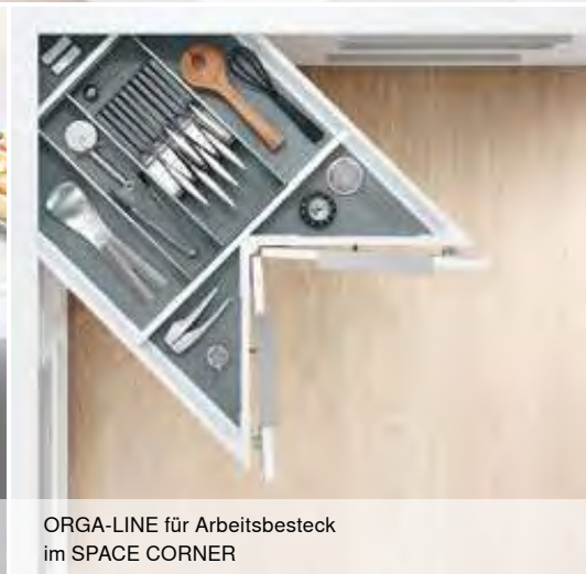
ORGA-LINE für Arbeitsbesteck im SPACE CORNER