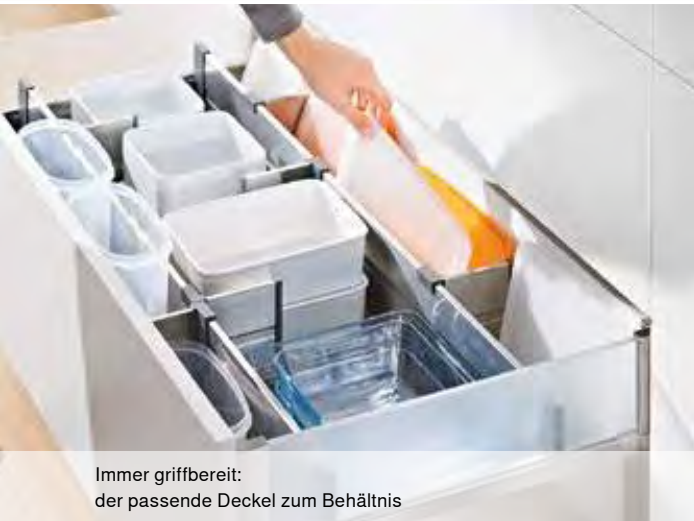
Immer griffbereit: der passende Deckel zum Behältnis