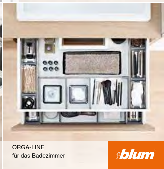
ORGA-LINE für das Badezimmer