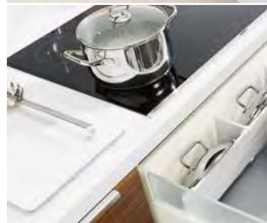
ORGA-LINE für Töpfe, Deckel und Kochbesteck