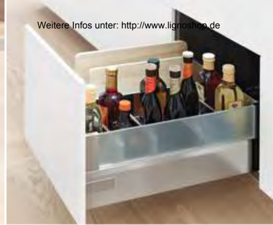
ORGA-LINE für Flaschen und Schneidbretter