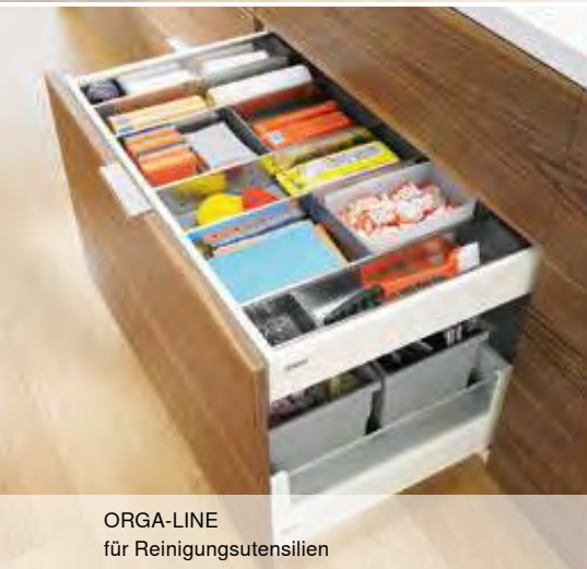
ORGA-LINE für Reinigungsmittel