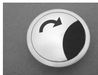
3. Arretierung durch leichte Drehung / Fix by turning

Seitlicher Einbau möglich: Der Deckel ist durch eine Arretierung gesichert. Dadurch können auch dicke und starre Kabel den Deckel nicht hochdrücken.