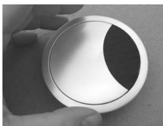
2. Deckel einsetzen / Insert cover