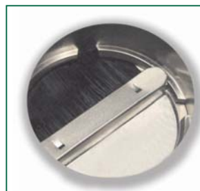
Ansicht von unten / View from below